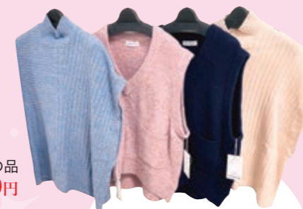
ウールベスト (サイズ38・40) 27,500円~39,600円の品 11,000円