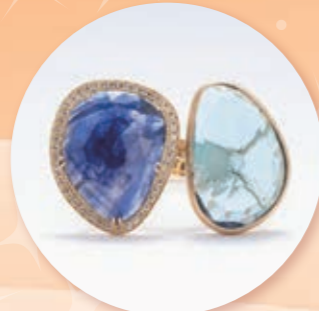
K18タンザナイト アクアマリンリング