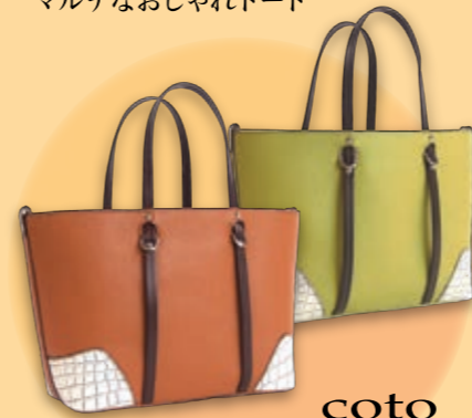
coto we make something we want カーフ / クロコバッグ 143,000円