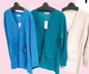
カシミアカーディガン (サイズ38・40) 107,800円の品 22,000円