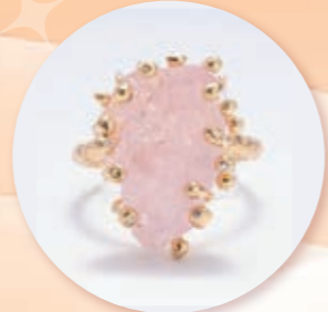
K18ローズクォーツリング