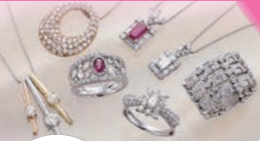
Ptダイヤモンド (0.10CT) 92,000円の品 38,000円