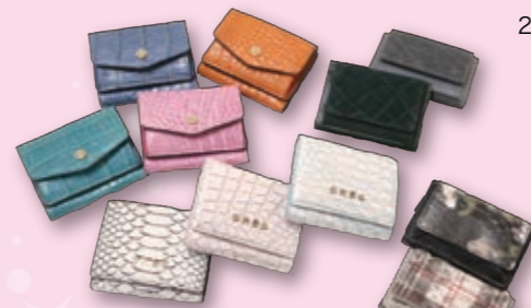
コンパクト三ツ折り財布 (パイソン・エレファント・クロコダイル) 14,300円~