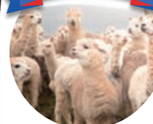
アンデス山脈の3,000m~5,000mの高地で放牧