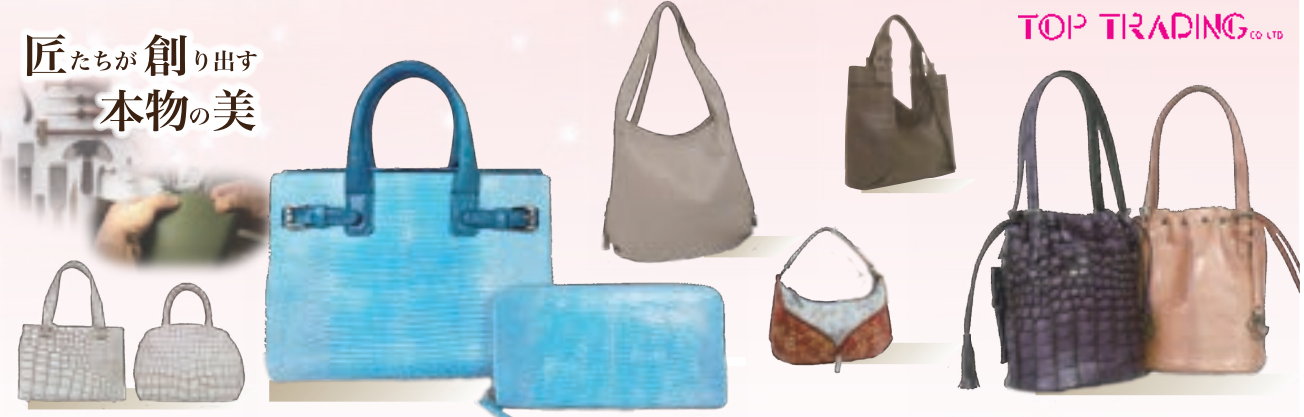
TOP TRADING Co. Ltd