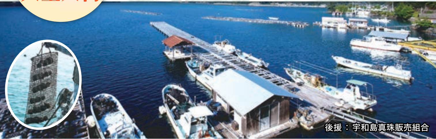
後援：宇和島真珠販売組合

新しい年を迎え、真珠養殖の本場『宇和島(愛媛)』より真珠が大量入荷しました(日本の全生産量の6割が宇和島産です)