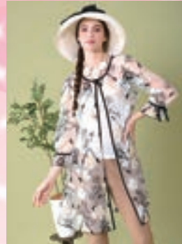
ブリリアント ア・デュール Brilliant a Dew!