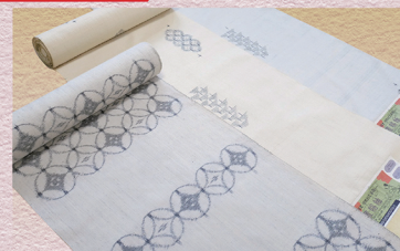
置賜紬 きもの (紅下染・手引き真綿) 418,000円の品 → 198,000円