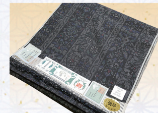
重要無形文化財 ユネスコ無形文化遺産 本場結城紬 100亀甲細工柄 きもの