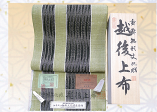
重要無形文化財 ユネスコ無形文化遺産 越後上布 八寸名古屋帯