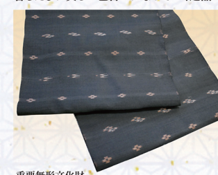
重要無形文化財 本場久米島紬 本泥染織 きもの