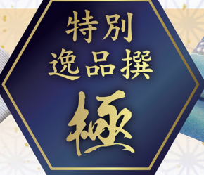
幻の辻ヶ花 久保田一竹袋帯