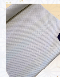
本場琉球 南風原花織 きもの