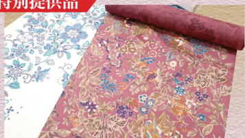
大島紬更紗文様 きもの 330,000円の品 → 138,000円