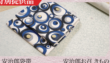
安治郎袋帯 418,000円の品 → 198,000円