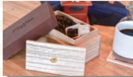
コーヒーキャニスター